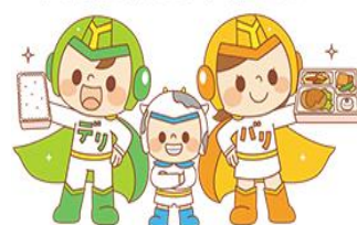
中学校給食マスコットキャラクター