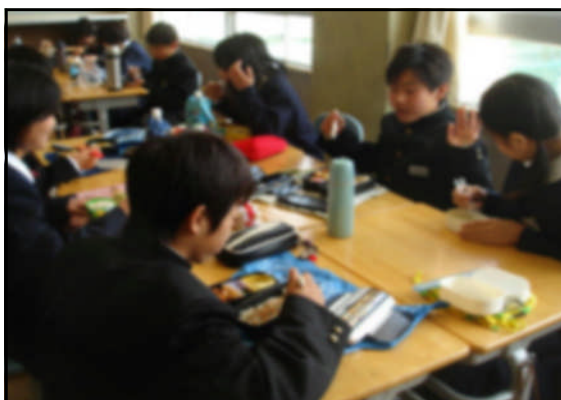
初めてのお弁当はとても楽しそう

続いて学活の後半で行なったのは班づくり。5月末の自然教室もここで作った班で活動することになります。「誰とでも仲良くできるクラスに」という担任の願いを全員が受け止めてクジ引きによる決定となりました。すぐにでき上がったばかりの班で班会議を行ない、班の仕事の決定、仕事の分担、掃除区域の分担などを行ないましたが、どの班もとてもスムーズに話し合いができ、そのままの隊形で初めてのお弁当を食べる頃には、かなりみんながほぐれて笑顔がたくさん見られました。