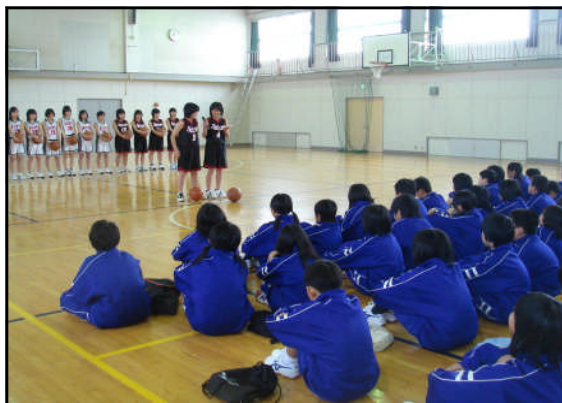
部活の紹介を熱心に見ています

入学式からちょうど一週間の様子をお伝えしました。さらに詳しい様子につきましては、それぞれのクラスで担任が発行している「学級通信」の方をご覧下さいませ。