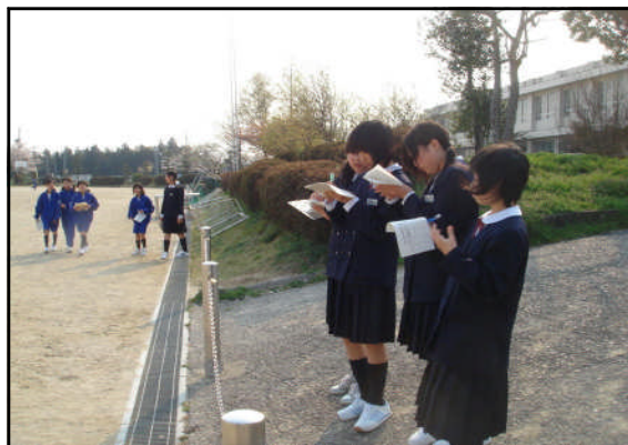
見学した感想をメモしています

前述の通り、11日より見学・体験期間が始まりました。この5日間ですべてのクラブを見学し、18日までに入部するクラブを決めなければなりません。詳しい日程は下の表の通りです。また、各クラブの練習日や時間帯、必要な経費などをまとめたプリントをすでに配布してあります。必ずご一読いただき、決定の際に参考にして下さい。