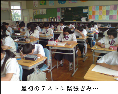
最初のテストに緊張ぎみ…

中学校入学後、初めての定期テストが行われました。自分の立てたテスト勉強計画をもとに今日まで頑張ってきたことと思いますが、それぞれのご家庭での様子はいかがでしたでしょうか？来週に入るとそれぞれの教科でテストが返ってきますが、点数のみにこだわらず、今回の学習計画そのものや実行する姿勢について振り返ることが大切だと思います。また、つまづいている部分を明らかにし、これを夏休みに復習するという計画を立てるのも必要なことだと思います。