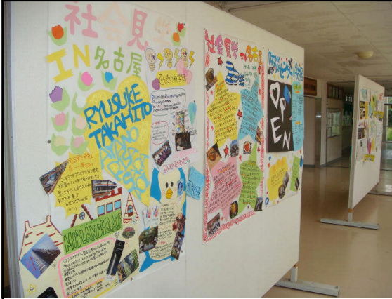
中央廊下に全班の新聞を掲示しました

約10日間取り組んできた社会見学の壁新聞ですが、先週末ですべての班が完成し、今週月曜日から掲示をしてあります。6月6日の「学校公開日」にご来校の予定がございましたら、ぜひ見てあげてください。また、その後は3年生の修学旅行の壁新聞が同じ場所に掲示されますので、いったん撤去しますが、7月の保護者会の際には、2年生の廊下付近に掲示することになります。