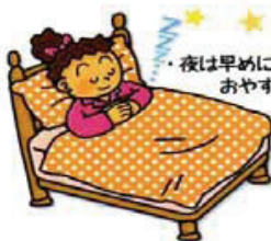
夜は早めにおやすみ〜!