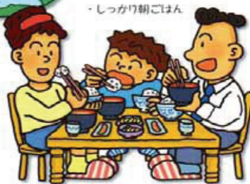
しっかり朝ごはん