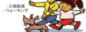
公園散歩 ウォーキング

「早寝・早起き朝ごはん」国民運動とは? ・学力・体力・気力の向上を図る ・望ましい基本的生活習慣を育成 ・生活リズムの重要性を再認識 ・地域ぐるみで支援するための環境整備 など 地域社会、学校、家庭が一体となって、心身共に健康な子どもたちの育成をめざします。 今後……… ・関係団体の協力を得て、民間主導の国民運動を展開する。 ・各地域における様々な取り組みが推進できるよう支援する。