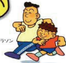
早朝親子マラソン