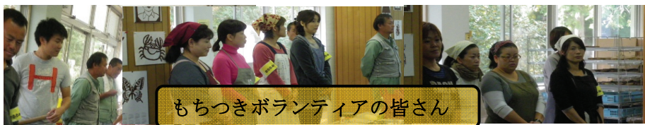
もちつきボランティアの皆さん