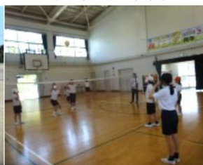
ソフトバレークラブ