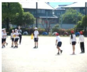
ドッチボールクラブ