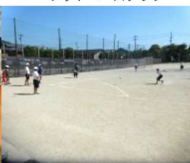
フットベースクラブ