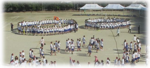
縦割りクラスで円陣を組むようす

午後からは、生徒会種目を行いました。生徒会種目は縦割りクラス（例えば各学年の1組が1つのチームになるなど、学年をこえたチーム編成）による綱引きのトーナメント戦です。3チームとの戦いを制した（試合では2勝したチームが勝ちぬけ）5組チームが見事優勝しました。また、先生チームとの勝負にも5組チームが勝利しました。おめでとうございます。