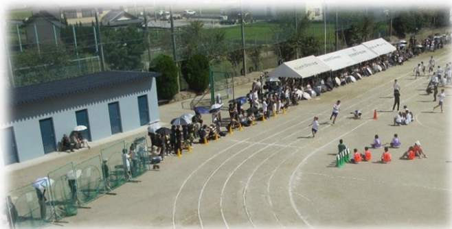
たくさんの保護者の方々からの応援

保護者の皆様には、お忙しい中、ご参観いただくとともに、生徒に声援を送っていただきありがとうございました。