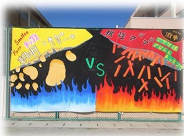
美術部作成スローガン