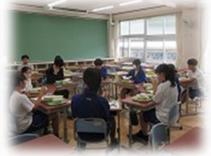
ランチミーティング

コロナ禍以降、多くの小学校や中学校が半日開催とする中、朝明中学校は午後からの競技も実施しています。計画、準備段階から生徒が主体的に活動し、学級や学年の仲間づくりを進めるとともに、今後の「生きる力」につなげていくため体育祭を飛躍の場と位置づけ実施しています。