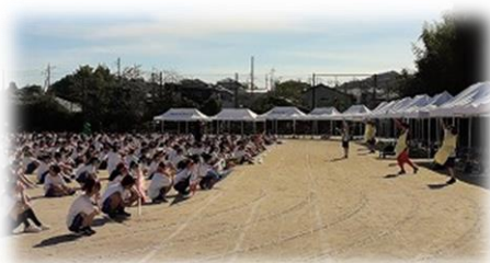
生徒会セレモニー