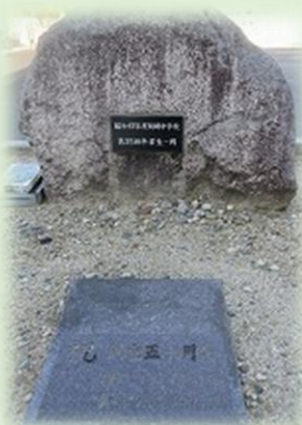
正門付近に埋設されているタイムカプセル