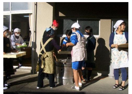
福寿会と郷土料理作り