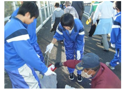
北勢バイパス高架下清掃活動