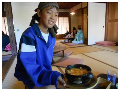
和みカフェゆるり