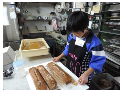
ケーキハウスシンフォニー