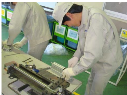
朝明精工業伊坂工場

【職場体験学習 (10/14~16)】(概要) 地域の事業所と関わる中で、地域・職業に対する関心を高め、地域の方とのふれあいを深める。