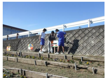
フラワーオアシス看板設置