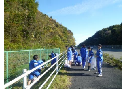
富田・山城道路清掃活動