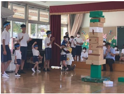
2年生：保育実習（西白市幼）