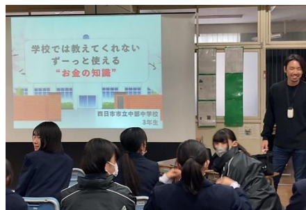
3年生：金融（投資）授業