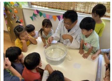
中部中→中央保：水で遊ぼう