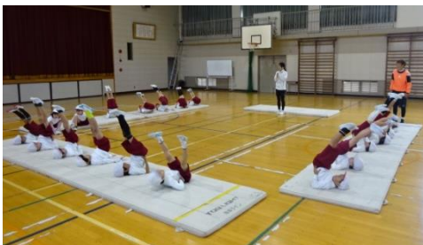
中部中→中央小：マット運動