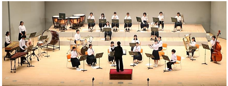
えんそう すいそうがくぶ クラブ演奏：吹奏楽部