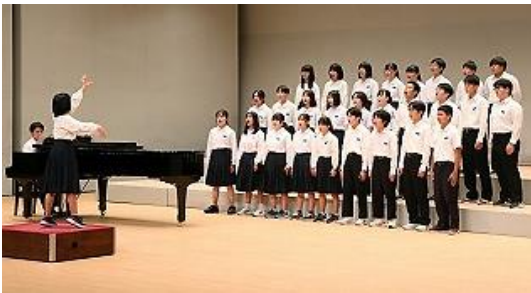
さんしおんがっかい 三泗音楽会 がっしょう 合唱：3年2組