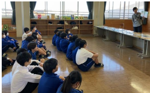
中央保育園→中部中：読み聞かせと絵本の展示