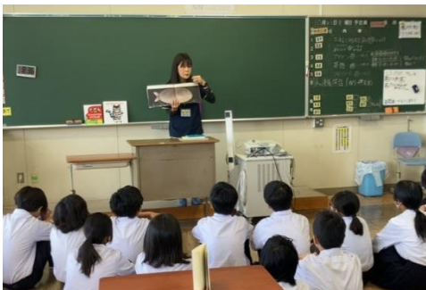
中央小→中部中：読み聞かせ