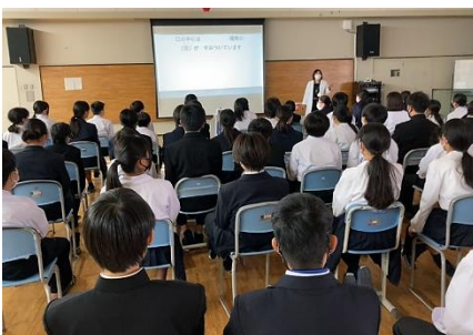
ねんせい しか はみがき しどう 1年生：歯科（歯磨き）指導