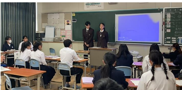
ねんせい せんもん がっか そうごう がっか がくしゅうかい 2年生：専門学科・総合学科学習会