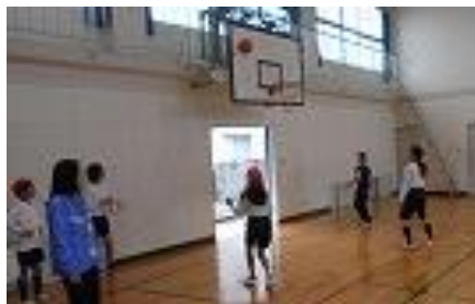
中部中→中部西小：バスケットボール