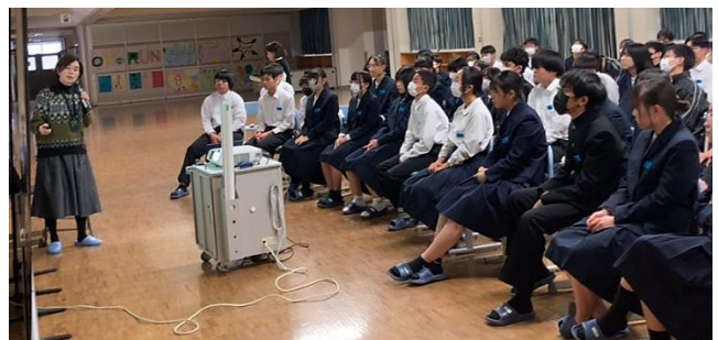
ねんせい せい せいめい じゅぎょう 3年生：性と生命にかかわる授業