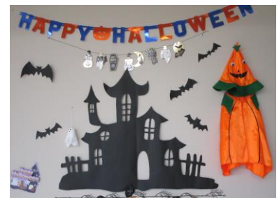
【図書ボランティアのみなさんによる作品】

本の選び方も、図書室や書店で偶然見つけた本、友だちに紹介された本、ご家族が読んでいて家にあった本・・・などいろいろあると思います。橋北小学校の子どもたちにも、一生心に残る本との出会いをしてほしいと思います。そして、その本について、友だちやご家族と話ができると、本の世界は、さらに広がっていくのではないのでしょうか。