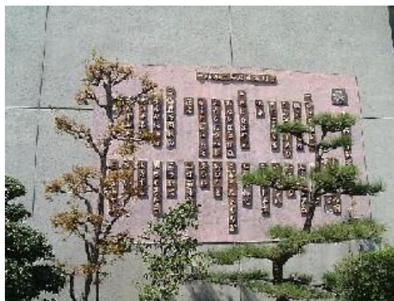
《校舎の壁面を飾る校歌》

『子ども達が自尊感情を高め、仲間とともに最後まであきらめずにやり抜く力を身に付けてほしい』という願いのもと、保護者・地域とともに学校教育活動を進めていきたい。