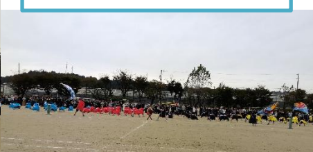
3・4年生 桜台ソーラン

櫓をこぐ姿、網をたぐり寄せる姿はとても力強かつよかったです。「ソーランソーラン」の掛け声も大漁旗もすばらしく、見ている方も元気になりました。