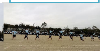
5・6年生 明日への START

「つながり」を感じました。仲間を信じ勇気を出して挑戦した姿にも深く感動しましたし、「一生忘れない、かけがえのない時間」となりました。