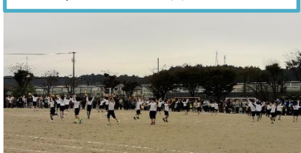
1・2年生 スマイル☆オンリーワン

一人一人がリズムを感じて、体全体で踊っていました。笑顔が光り輝いていました。かっこよさとかわいらしさの二つを感じることができました。