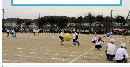
3・4年生 運をつかむのはどのチーム?

まさに勝敗は時の運。背中でボールを運ぶのが難しそうでしたが、みんなが競技を楽しんでいました。