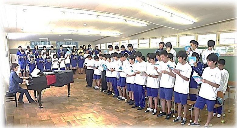
【 全体での合唱練習 】