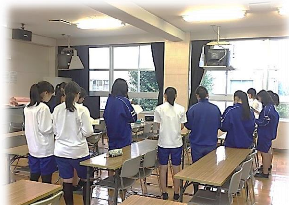
【 パート別練習 】