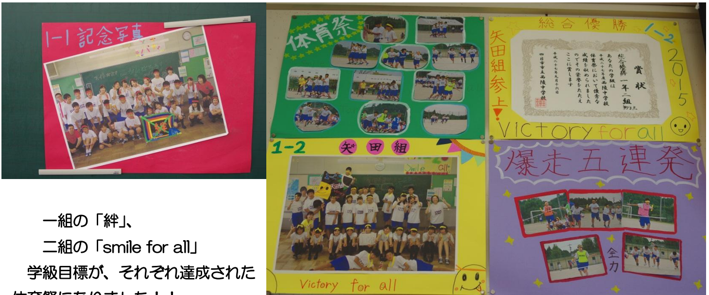
一組の「絆」、 二組の「smile for all」 学級目標が、それぞれ達成された 体育祭になりました！！