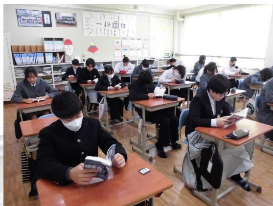
↑ 2年生 ↑