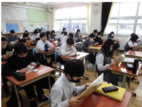
↑ 1年生 ↑