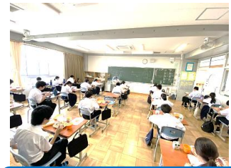
1年生昼食時の様子

すでにお知らせした通り、10月4・5日に2学期の中間テストを実施します。本日テストの時間割と出題範囲を発表しました。今回、3年生は国・社・数・理・英の5教科、1年生は5教科と技術、2年生は5教科と家庭のテストを行います。今回の中間テストは、1学期末テスト後の学習内容が主な範囲となります。予定通りに体育祭が実施されていたら、その練習等で授業がぬけてしまうところですが体育祭が延期になり、オンラインとはいえ授業が進められたのは良かった点ではあります。反対に、オンライン授業もできるだけ対面授業に近い内容で実施したとは言え、十分でないところもあったと思います。うまく理解できなかった部分等については、もうすでに各担当の先生に質問した人もいますが、今週に予定されている質問日等をぜひ有意義に活用してください。この1週間、集中してテスト勉強に取り組み、良い準備をして、良い結果が得られるように頑張りましょう。