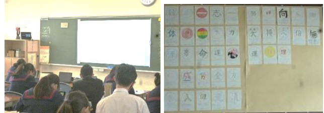
2年生「今年の一文字」の様子