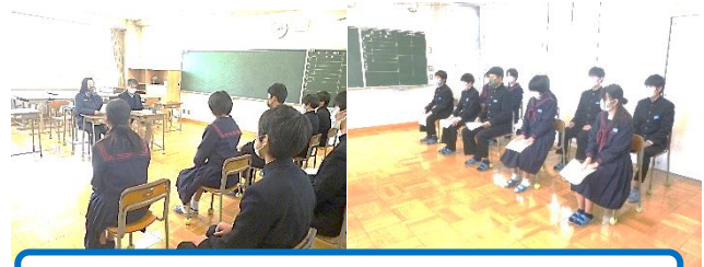
3年生「面接練習」の様子

1年生は、「学年末テストに向けてどのように取り組むか」を各自で考えていました。学年末テストは、2月22日(火)からの予定ですから1カ月以上ありましたが、3年生が「学年末テスト」にあたる「卒業テスト」をこの日終えたばかりで、「2年後は自分たちの順番だ」という意識を持つためにも効果があったのではないのでしょうか。成果を期待したいですね。