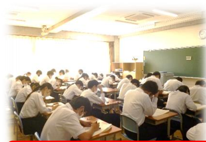
昨年度2学期中間テストの様子

更に「色々と試行錯誤を繰り返し、自分なりの方法を見つけることが大切」とも伝えていました。「書いて覚える」、「繰り返し読んで覚える」等々、色々な方法をまず試してみてください。今の結果も気になると思いますが、先の結果も見据えながら取り組むことも大切です。そのためにはある程度時間がかかります。やはり「努力に勝る天才なし」です。ただ時間をかければ良いというものではないかも知れませんが、取り組む時間が少なすぎでは難しいと思います。「良い準備は、良い結果を生む」私がいろいろな場面で伝えている言葉です。ぜひ良い準備をしてテストに臨んでください！