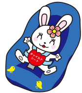
チャイルドシート着用推進 シンボルマーク「カチャビヨン」