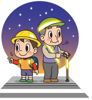
左右を確認しよう!